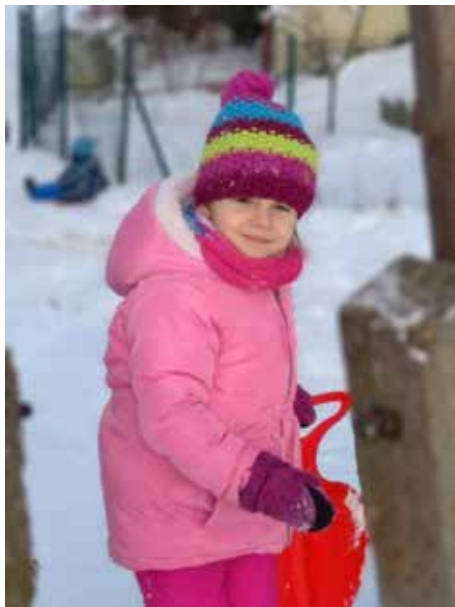
Začala opravdová zima a děti ji užívají plnými doušky.